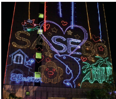
2023年の壁面イルミネーション (テーマ:「私が考える、未来のSASEBO。」)

※原稿の返却はいたしません。 ※当選したデザインは、一部修正を加える場合があります。予めご了承ください。