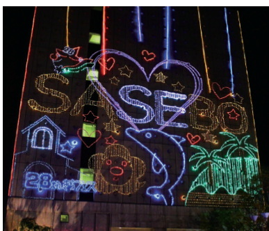
2023年の壁面イルミネーション (テーマ:「私が考える、未来のSASEBO。」)

※原稿の返却はいたしません。 ※当選したデザインは、一部修正を加える場合があります。予めご了承ください。