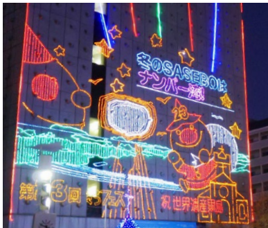
2018年の壁面イルミネーション (テーマ:冬のSASEBOは ナンバーワン!)

※原稿の返却はいたしません。 ※当選したデザインは、一部修正を加える 場合があります。予めご了承ください。